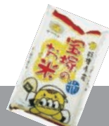
兵庫六甲農業協同組合