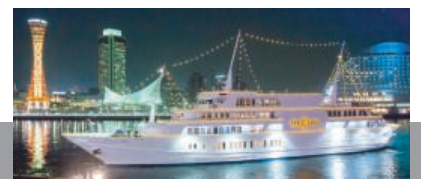
株式会社神戸クルーザー