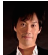
吉永 真悟 作曲家/音楽プロデューサー